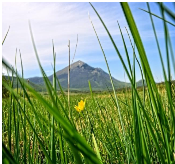
Слика број 1 - Боговинска пећина и планина Ртањ