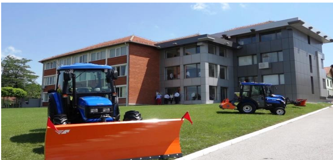
Слика број 2 - ФПМ Агроеханика Бољевац