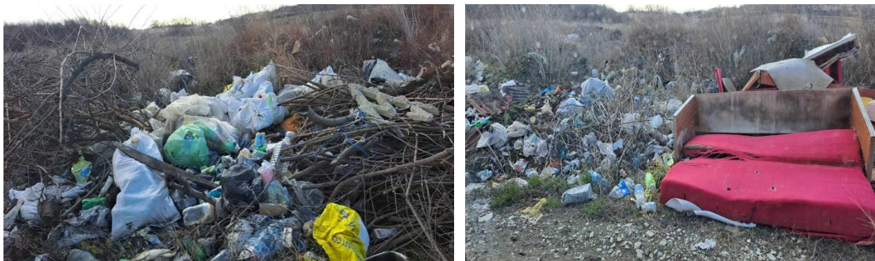
Слика број 8 - Дивља депонија (Пг-2) у селу Подгорац