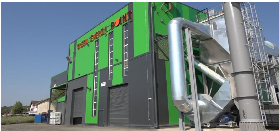
Слика број 3 - „Green Energy point” Бољевац

Производи топлотну и електричну енергију. Когенеративно постројење је капацитета 2,38 MW/h електричне енергије и 8,3MW/h топлотне енергије. Компанија је почела да ради јула 2019. године. Прво је и једино постројење тог типа у Републици Србији. Скоро комплетна топлотна енергија која се произведе користи се за потребе производње пелета у погону Bio Energy Point , током целе године, што постројење чини енергетски ефикасним. Са јавним предузећем Електропривреда Србије је потписан уговор о продаји електричне енергије из обновљивих извора. Сагоревањем биомасе се не повећава CO 2 у атмосфери и тиме се остварује позитиван утицај на животну средину.