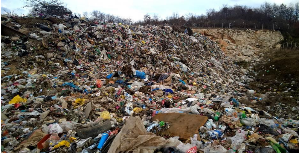
Слика број 6 - Несанитарне депоније »Обла«

Несанитарна депонија „Обла“ почела је да се користи 1994. године. Мзв. „Обла“ на КП бр. 10189, КО Јабланица одређено је као место на које ће се одлагати комунални отпад до изградње регионалне депоније - Одлука СО Бољевац бр. 06-591/05-1/8 од 1.09.2005.