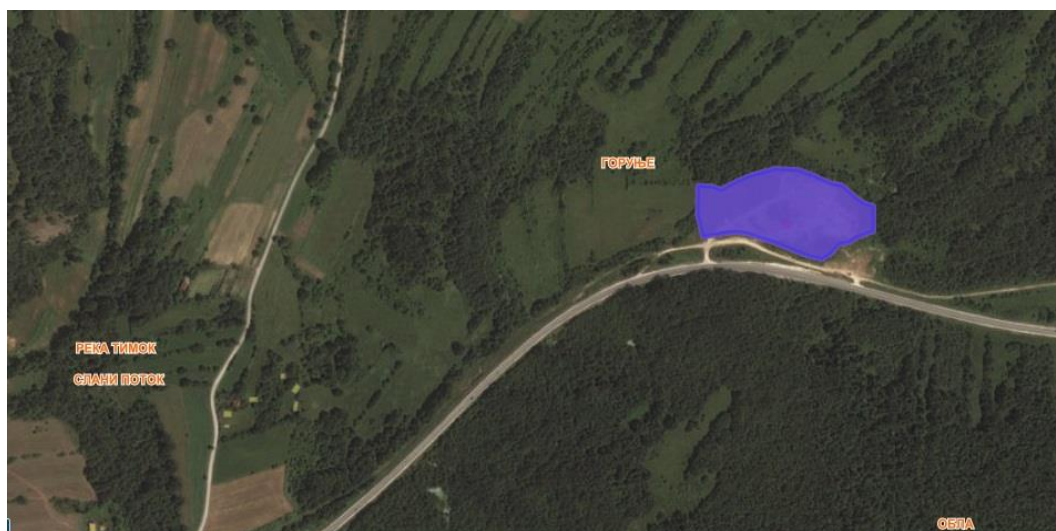
Слика број 5 - Сателитски снимак несанитарне депоније »Обла«

Несанитарна депонија отпада „Обла“ за општину Бољевац формирана је на КП 10189 КО Јабланица, на простору напушеног каменолома, неправилног издуженог облика у смеру запад-исток. Несанитарна депонија налази се уз сеоски и државни пут ИБ-36 Параћин -Зајечар –државна граница са Бугарском (гранични прелаз Вршка Чука). Најближа насеља су село Луково, налази се на удаљености од око 2 km, село Јабланица, налази се на удаљености од око 3 km, село Мирово, налази се на удаљености од око 4 km, насеље Ртањ налази се на удаљености од око 8 km. и седиште град Бољевац је на удаљености 8 km. Река Мишовица, која припада сливном току Тимока налази се удаљена од депоније око 1,5 km а Црни Тимок (Црна Река) око 500 m од депоније. Депонија је лоцирана на падини која има пад ка северозападу, односно алувијону Црног Тимока. Просечна надморске висина терена око депоније је 360-375 mnnv, док је плато формиране депоније субхоризонталан са kotaма око 370-372 mnnv. Приступ депонији је са споредног (земљаног) пута који излази на магистрални пут. У