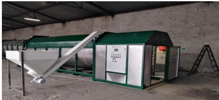
Слика број 10 - Пример био-стабилизатора

Биостабилизација у управљању отпадом се разликује од уобичајеног и чешће коришћеног компостирања отпада јер укључује већу разноврсност материјала садржаних у комуналном отпаду и токовима органског отпада, представља контролисани процес, пројектован тако да обезбеди компост у краћем времену, производи нижу минералну вредност компоста, што га чини добрим регенератором земљишта, а не ђубривом, садржи стопу активности микро-организама, која је контролисана редовним окретањем и/или прозрачивањем.