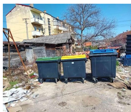
Слика број 4 - Возила и контејнери за рециклабилни отпад ЈКП“Услуга“ Бољевац